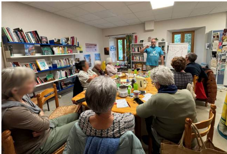
Mai 2025 : Marathon du numérique En partenariat avec le Pôle Séniors d'Aubenas 10 pers.