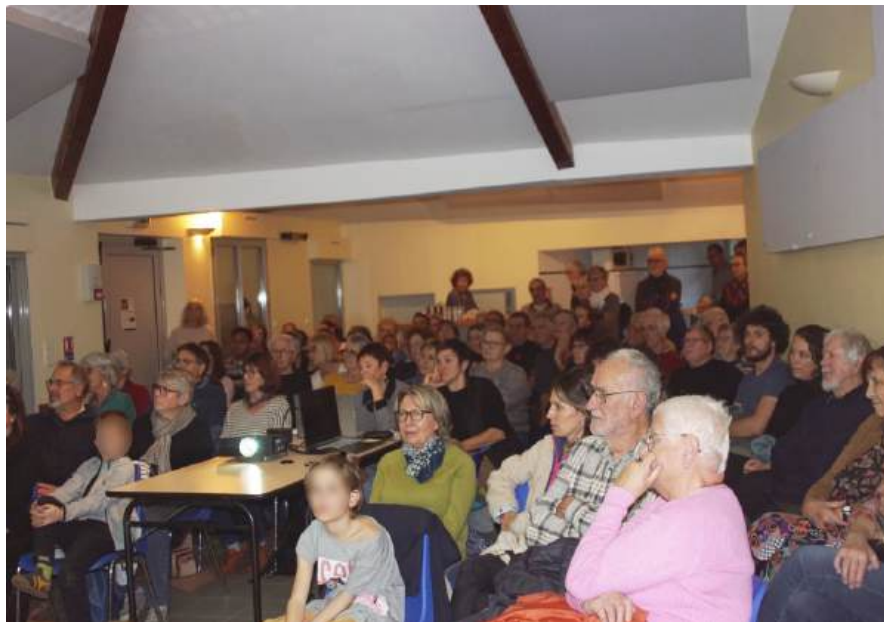
Novembre 2025 : Projection documentaire dans le cadre des Sentiers du doc (MDA Ardèche, Ardèche Images) En partenariat avec les bibliothèques d'Antraigues et de St Joseph des Bancs, avec le soutien du Comité des fêtes de Bise 85 pers.