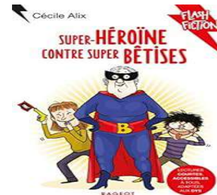
Lectures à l'école 6 séances