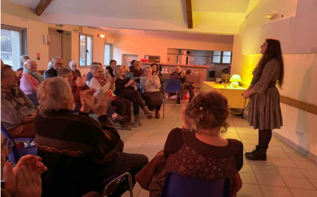
Janvier 2025 : Nuits de la lecture Événement national « Si Nanette m'était contée » 34 personnes ( budget 2024 )