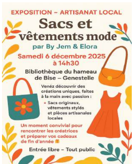
Expo Noël 35 pers.